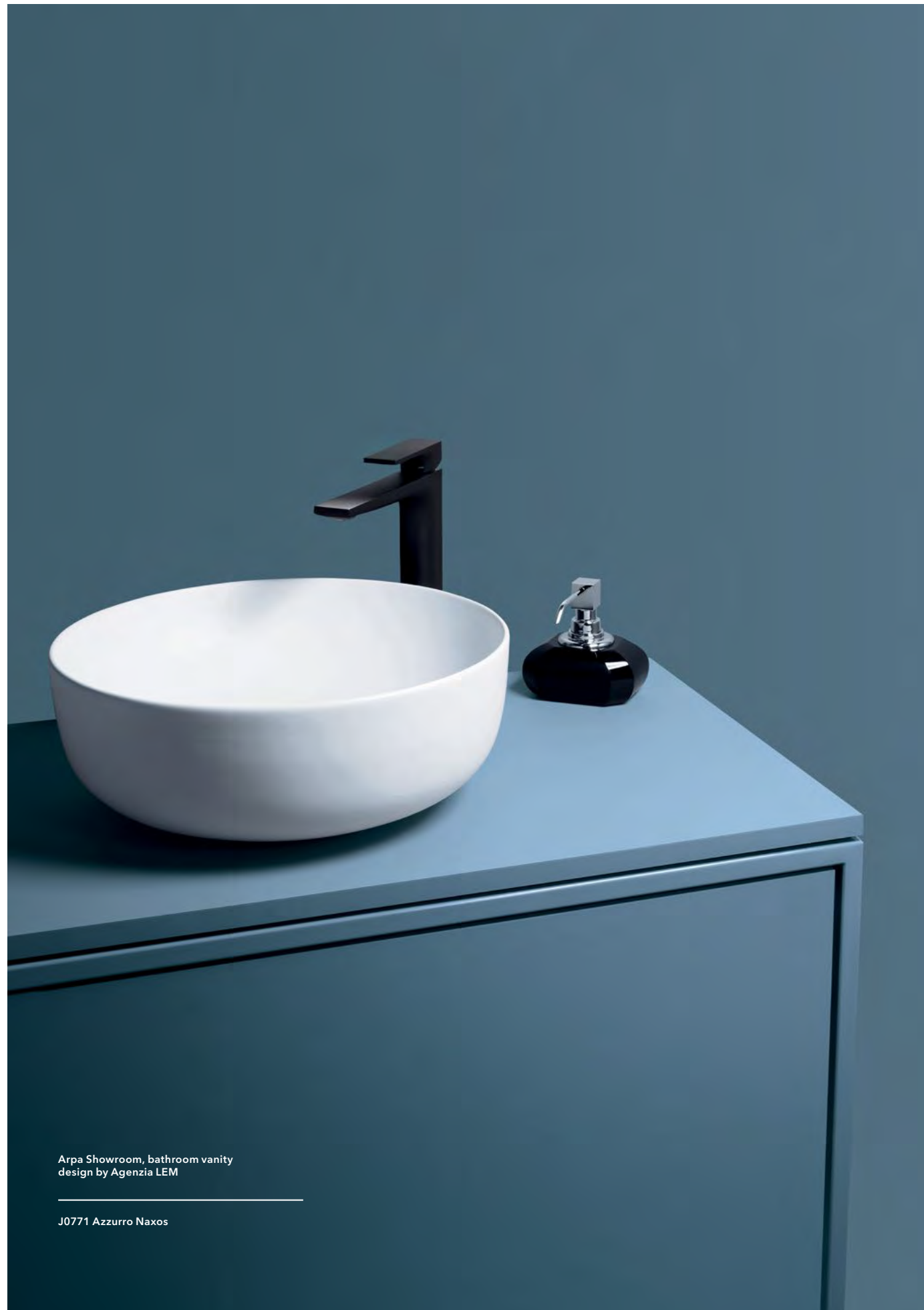
Arpa Showroom, bathroom vanity design by Agenzia LEM