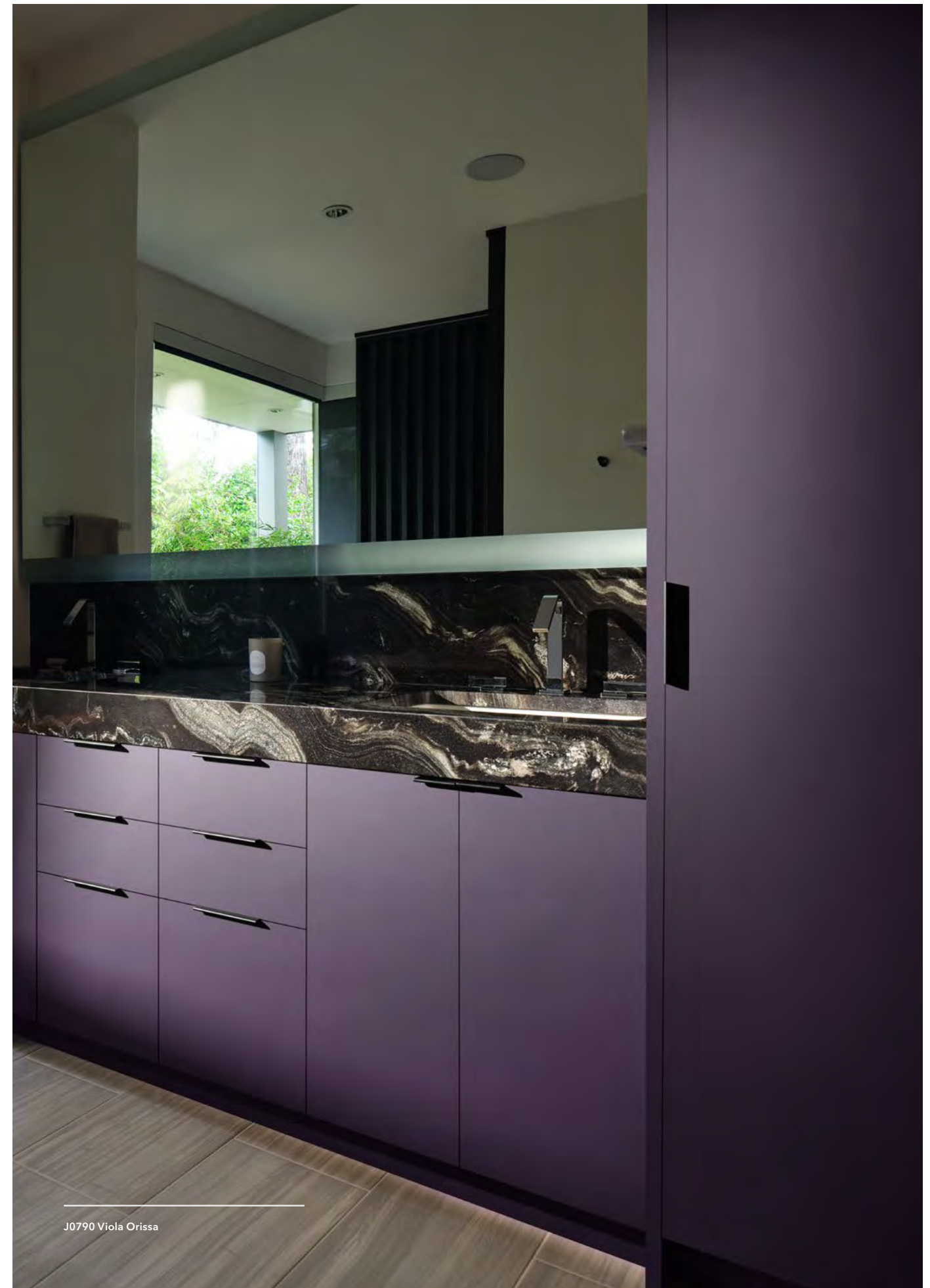
J0790 Viola Orissa

Protective film included. FENIX NTM can be machined with standard carpenters tools. Película protectora incluida. FENIX NTM se puede trabajar fácilmente con herramientas de carpintería comunes. Pellicule de protection comprise. FENIX NTM peut être retravaillé avec les outils traditionnels du menuisier.