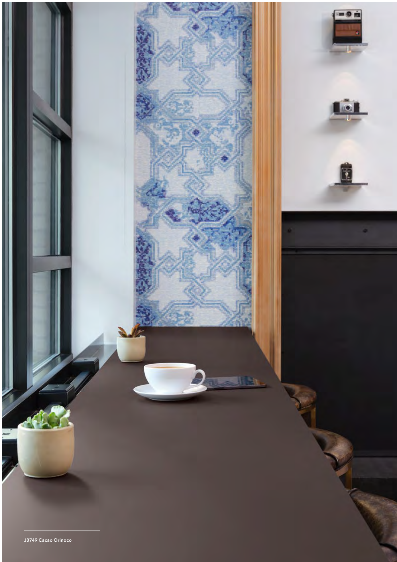
J0749 Cacao Orinoco